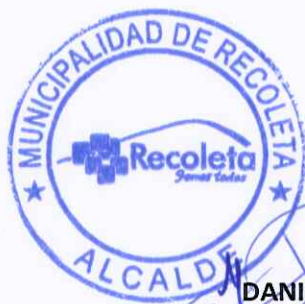
DANIEL JADUE JADUE ALCALDE